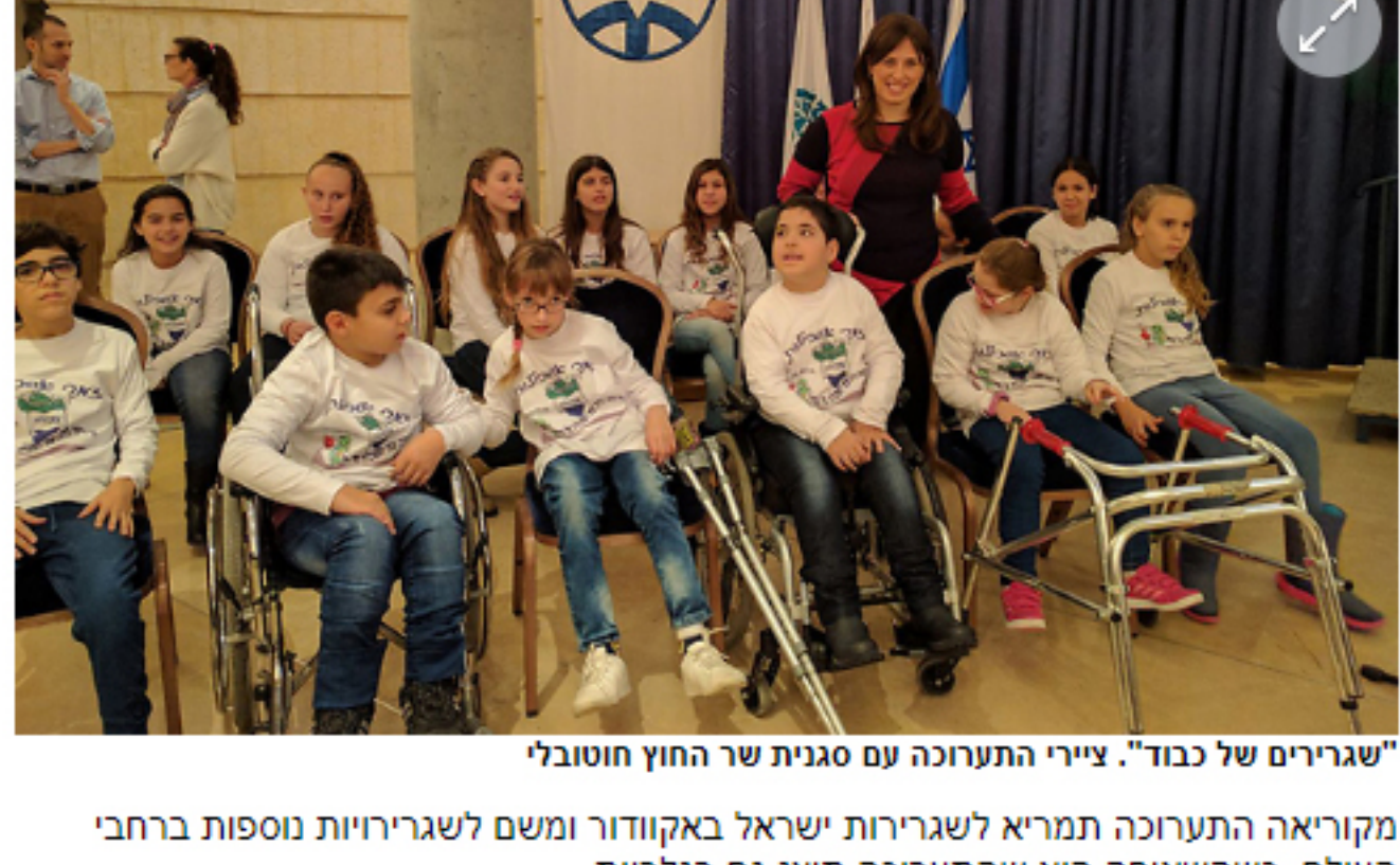
העולם, כשהשאיפה היא שהתערוכה תוצג גם בגלריות.

"היצירות המרשימות לא נופלות מיצירות של אמנים גדולים ויכולות להיות מוצוגות במיטב