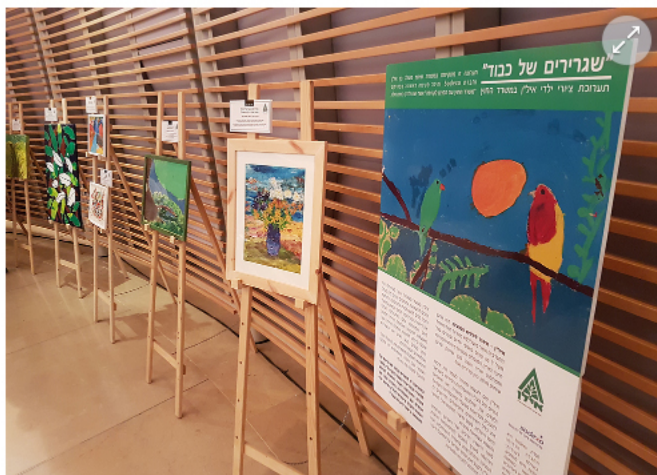
"שגרירים של כבוד". התערוכה החדשה של משרד החוץ

משרד החוץ השיק היום (ג') תערוכת ציורים יוצרת דופן תחת הכותרת "שגרירים של כבוד". התערוכה מורכבת מציורים שהכינו ילדי עמותת איל"ן (איגוד ישראלי לילדים נפגעים) והיא תנדוד בשגרירויות ישראל ברחבי העולם.