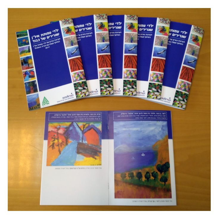
The brochure which was printed and given to the exhibition visitors, with the details about the cooperation between Sodexo on-site and ILAN foundation, the drawings and the children.

These are the table placemats with the children drawings prints, and some information about Sodexo On-Site, ILAN foundation and the painters themselves.