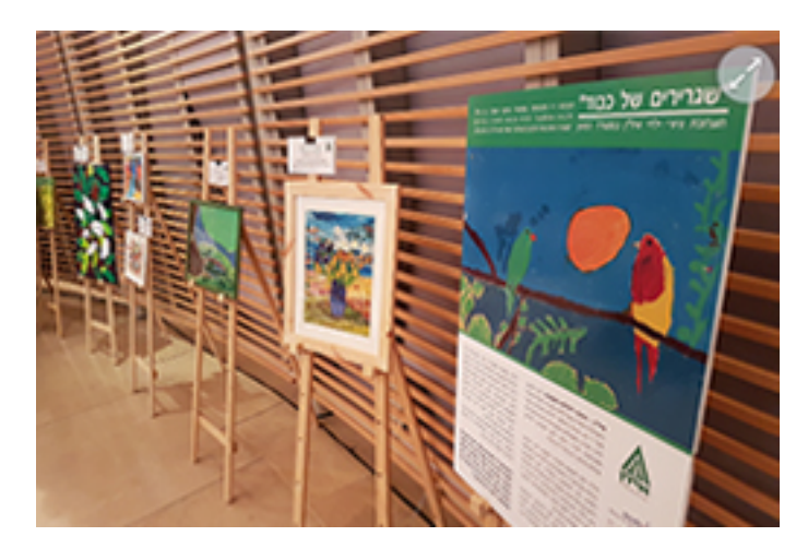
The second item on YNET – about the exhibition launch http://www.ynet.co.il/articles/0%2C7340%2CL-4908830%2C00.html

Item about the initiative and the cooperation between Sodexo on-site, ministry of Foreign Affairs and ILAN foundation